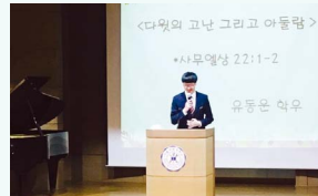
성봉 설교 대회