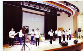
신학과 찬양팀 운영